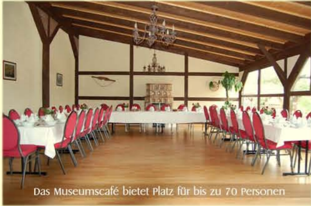
Das Museumscafé bietet Platz für bis zu 70 Personen

Das gemütliche Museumscafé wird auch weiterhin für Sie da sein. Hier können Sie, wie gewohnt, gut und preiswert essen oder in geselliger Runde einen Knobelabend verbringen. Nach dem Rundgang im Kutschenmuseum können Sie es sich bei Kaffee und selbstgebackenem Kuchen gut gehen lassen und Ihre Eindrücke und Erinnerungen nochmals auffrischen. Wenn Sie es vorziehen mit der Familie oder Freunden lieber im Museumscafé zu feiern, so ist auch das möglich. Nehmen Sie mit uns Kontakt auf um alles Weitere zu besprechen.